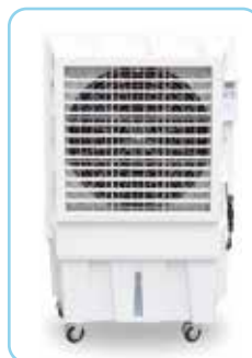
EPC-180 / 220